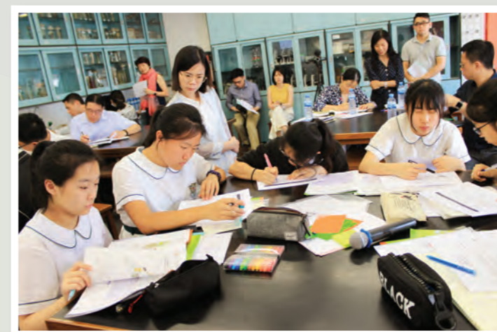
生物科教研公開課

為促進學校發展，本校於2010年連繫香港學習圈協會，引入新加坡的學習圈概念，以「Reflection- Plan- Act- Observation- Critical Reflection」模式鼓勵老師間的協作及反思，更成為關注事項「推動教學探究及分享文化」的策略之一。另外，建基學習圈概念的引入，本校亦同時開展各科組的行動學習。