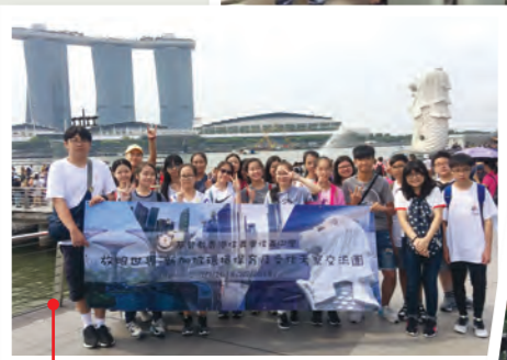
新加坡環境保育及文化交流團