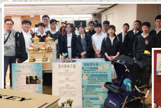
本校學生在「全港中學創新科技大賽2018」勇奪四項大獎