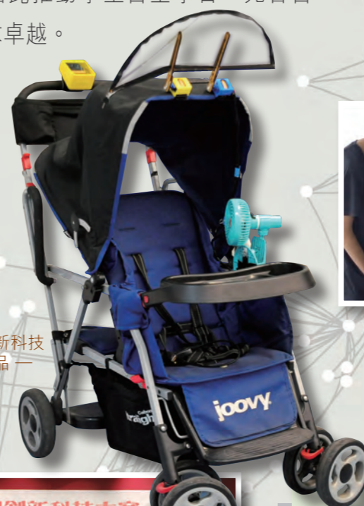
全港中學創新科技大賽獲獎作品—智能嬰兒車