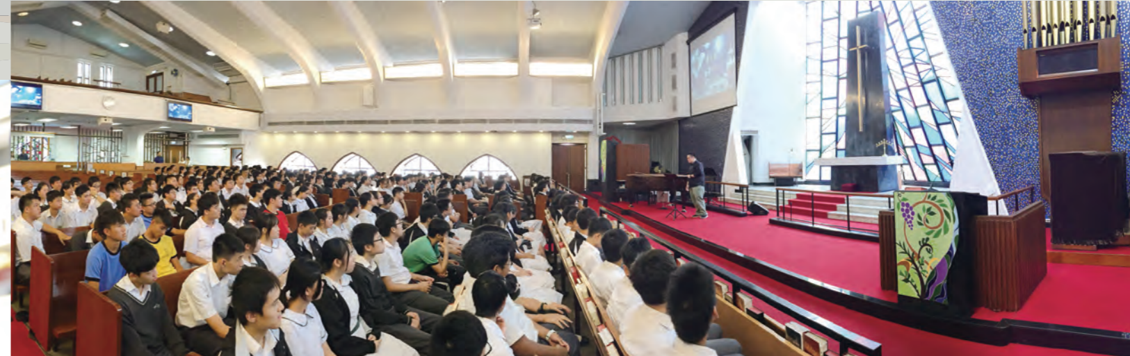
中四師生留心傾聽嘉賓的見証