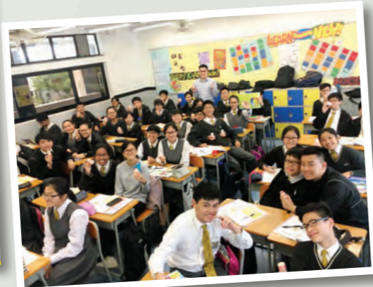
學生在感恩明信片上表達對老師的謝意