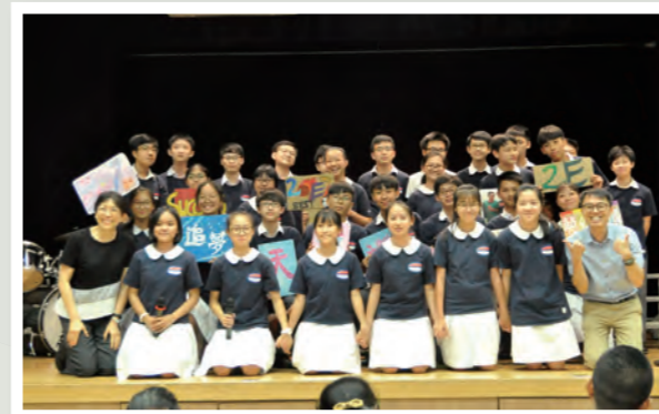
老師與學生一起參與班際詩歌比賽

「我們愛，因為神先愛我們。」本校乃基督教香港信義會屬下辦學團體之一，透過與真理堂達至堂校合一。學生從參與團契聚會、不同的基督教活動，認識上帝更多。藉著服事社區，傳揚基督的愛。