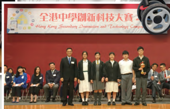
同學在教育局楊潤雄局長手上接過全場總冠軍獎盃