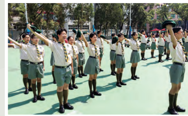
2018年傑出旅團暨傑出旅團領袖頒獎典禮會操及檢閱

2018年傑出旅團獎勵計劃以表揚獲獎旅團在過去一年內於行政、活動、訓練等各方面的表現有顯著進步。評審以團為單位，包括：小童軍團、幼童軍團、童軍團、深資童軍團及樂行童軍團。而本旅—1698童軍團及深資童軍團均榮獲傑出旅團獎勵計劃一金獎，並參與2018年傑出旅團暨傑出旅團領袖頒獎典禮會操及檢閱。