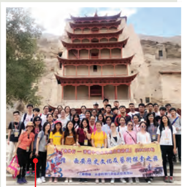
西安歷史文化及藝術探索之旅