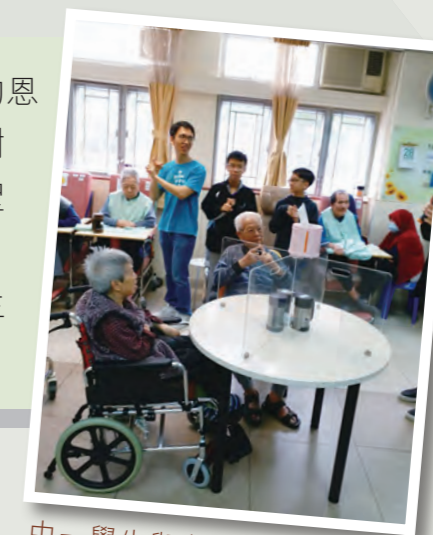
中一學生與老人中心的老友記歡度了一個下午