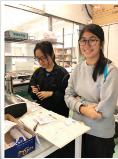
學生在午間宣讀感謝老師的留言