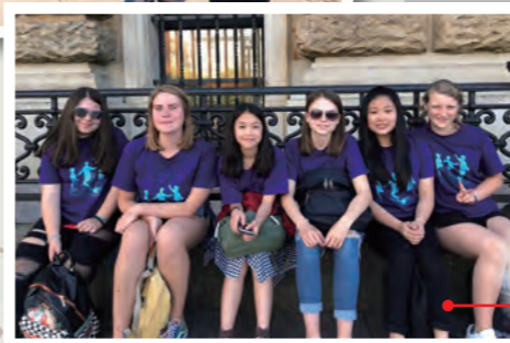
德國文化歷史交流團