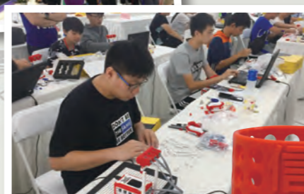
有些同學在拼砌機械車，有些同學則在編寫驅動車子的程式。