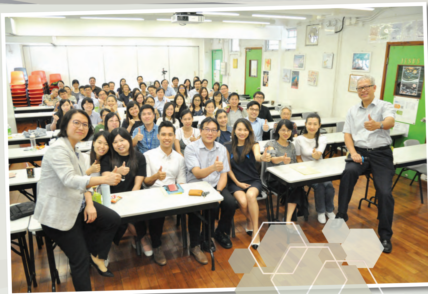
本校行動學習分享會