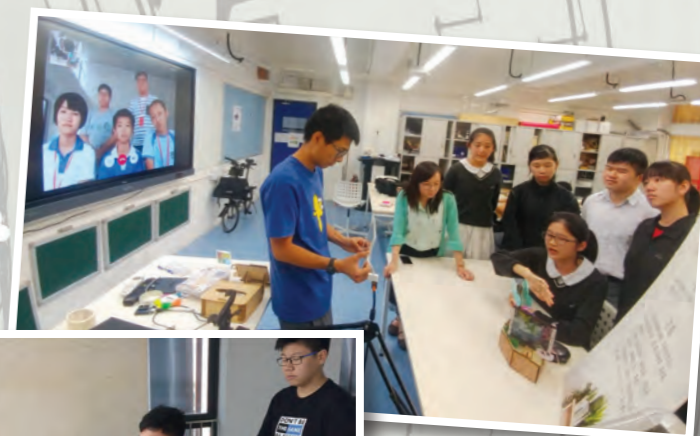
同學透過視像會議介紹比賽作品「室內智能花盆」