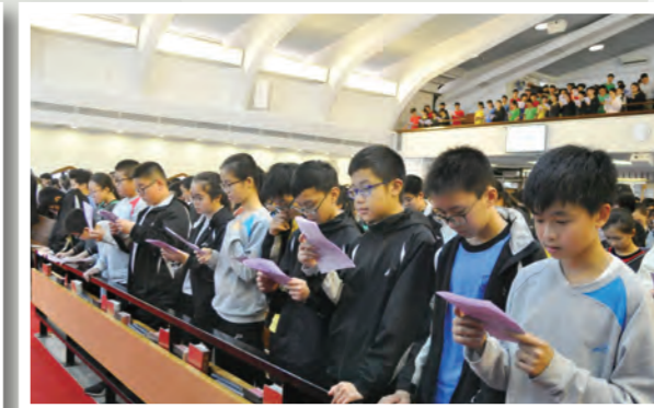
學生在真理堂參與崇拜