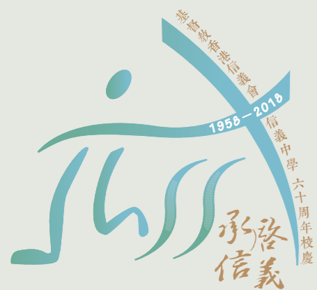
六十周年校慶標誌

六十周年校慶標誌蘊含四大元素：（一）創校「六十」周年；（二）學校英文簡稱「LSS」；（三）標誌右上方結合了代表信義的拱門和信仰的十字架；（四）標誌中間乃一位信義人在跑道上向着目標奔往，寓意同學在信義的學習路途上努力不懈，向着標竿直跑。