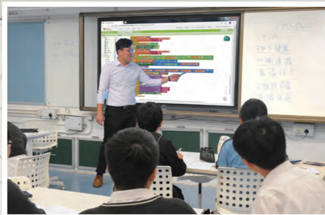
完善的科技配套有助推行先進的互動教學

本校積極運用最新的資訊科技設備和電子學習平台，鼓勵老師結合先進的資訊科技和優秀的教學法，優化課堂內外的學習效能。現時，本校每間課室皆配備最新Wifi寬頻和AppleTV，讓師生輕鬆地運用近百部iPad電腦進行多元化的電子學習活動。學校正積極優化特別室設備，安裝大型4K電腦互動屏幕，整合桌上電腦、平板電腦和各種電子媒體播放資源，讓老師運用科技推行高階的教學活動。