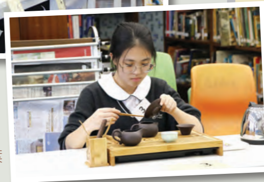
學生專注地把茶葉撥入茶壺中