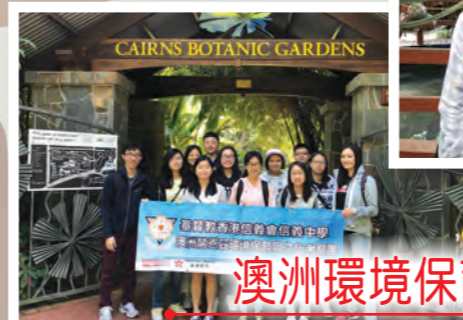
澳洲環境保育與文化考察團