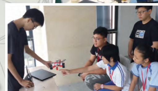
姊妹學校的同學通過FaceTime向香港同學解釋機械車的特點