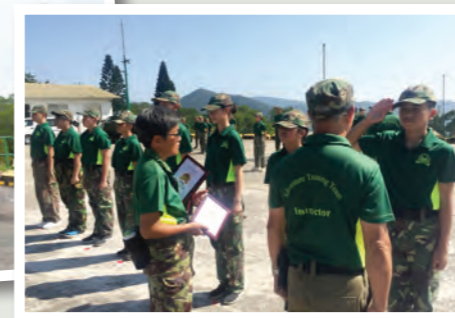
同學們努力堅持，終於成功畢業。