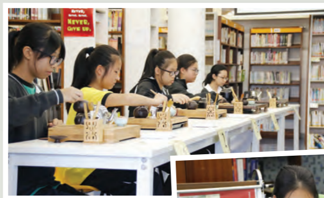
學生正進行茶藝考試