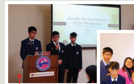
第62屆聯合國婦女地位委員會會議