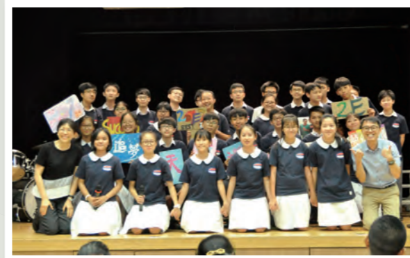
老師與學生一起參與班際詩歌比賽

「我們愛，因為神先愛我們。」本校乃基督教香港信義會屬下辦學團體之一，透過與真理堂達至堂校合一。學生從參與團契聚會、不同的基督教活動，認識上帝更多。藉著服事社區，傳揚基督的愛。