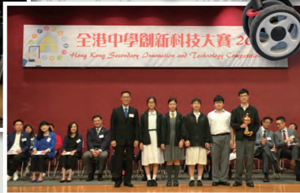
同學在教育局楊潤雄局長手上接過全場總冠軍獎盃