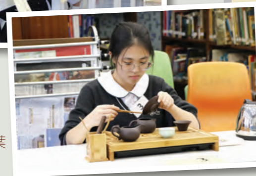
學生專注地把茶葉撥入茶壺中