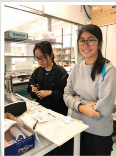
學生在午間宣讀感謝老師的留言