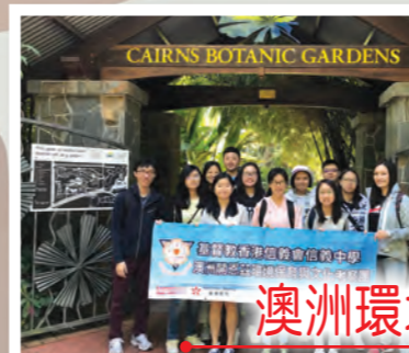
澳洲環境保育與文化考察團