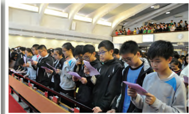
學生在真理堂參與崇拜