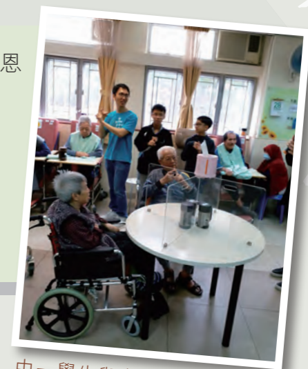
中一學生與老人中心的老友記歡度了一個下午