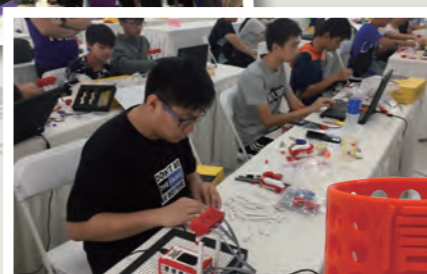
有些同學在拼砌機械車，有些同學則在編寫驅動車子的程式。