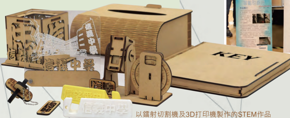
以鐳射切割機及3D打印機製作的STEM作品

學校亦積極鼓勵學生參與有關STEM的公開創作比賽。本校在「全港中學創新科技大賽2018」中，三組STEM小隊勇奪全場總冠軍、「智能環境化大獎」和兩項金獎，成績令人振奮。同學亦在 Cisco Innovation Competition 獲得優異成績。