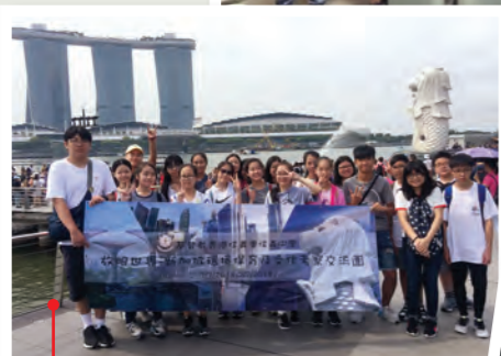
新加坡環境保育及文化交流團