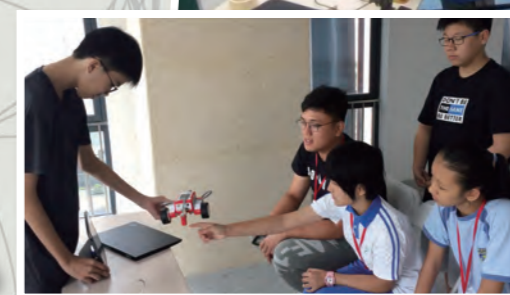
姊妹學校的同學通過FaceTime向香港同學解釋機械車的特點