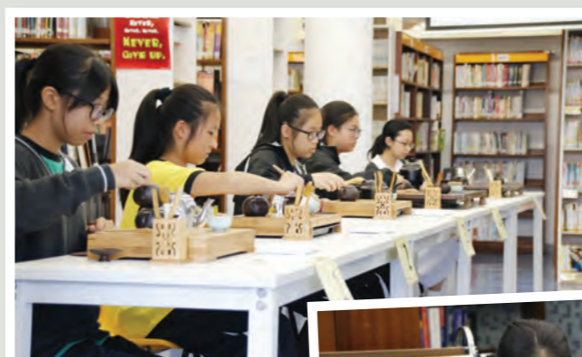
學生正進行茶藝考試