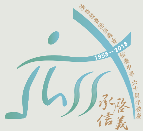
六十周年校慶標誌

六十周年校慶標誌蘊含四大元素：（一）創校「六十」周年；（二）學校英文簡稱「LSS」；（三）標誌右上方結合了代表信義的拱門和信仰的十架；（四）標誌中間乃一位信義人在跑道上向着目標奔往，寓意同學在信義的學習路途上努力不懈，向着標竿直跑。