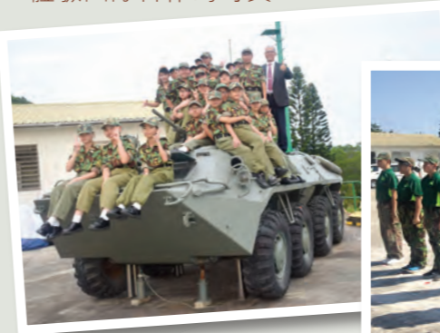
同學們努力堅持，終於成功畢業。