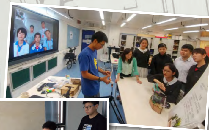
同學透過視像會議介紹比賽作品「室內智能花盆」