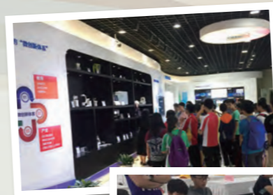
參觀中科院研究室，觀摩最新科技研究。