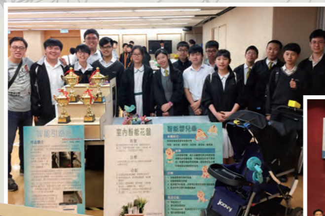
本校學生在「全港中學創新科技大賽2018」勇奪四項大獎

普通話科重視聯課活動，期望能多角度讓學生多說及多聽普通話。本科與多間內地學校締結為姊妹中學，透過互訪和電子通訊方式與友校的同學增加交流。這既能提升學生普通話水平，亦加深了解國內同學的學習及生活等情況。2018年7月，我校邀請姊妹學校一同參加「粵港澳大灣區聯校科創營」，參與者每天透過視像會議與本校師生分享科創營的生活體驗和學習成果。